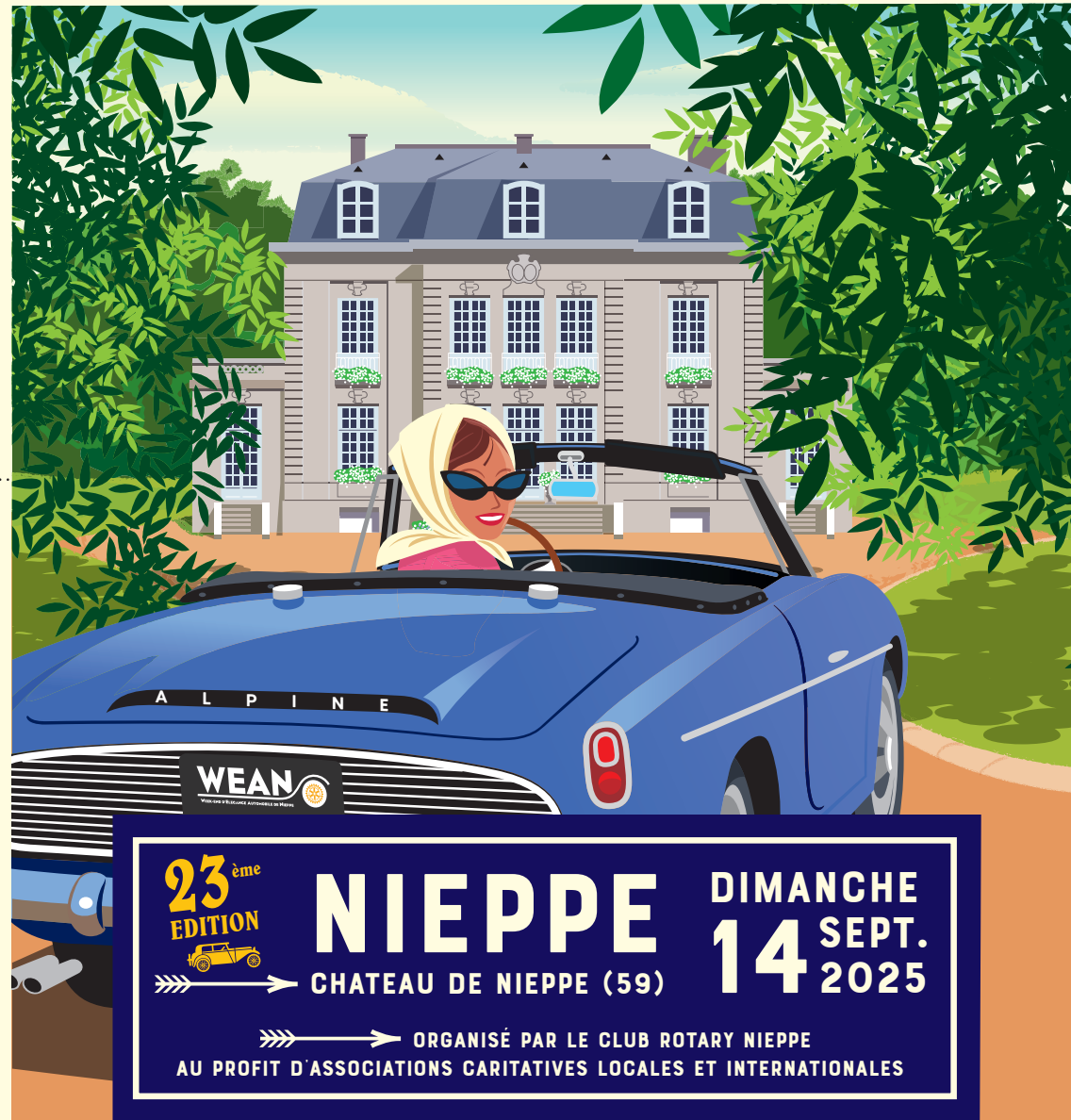
Design Graphique : BRUNO